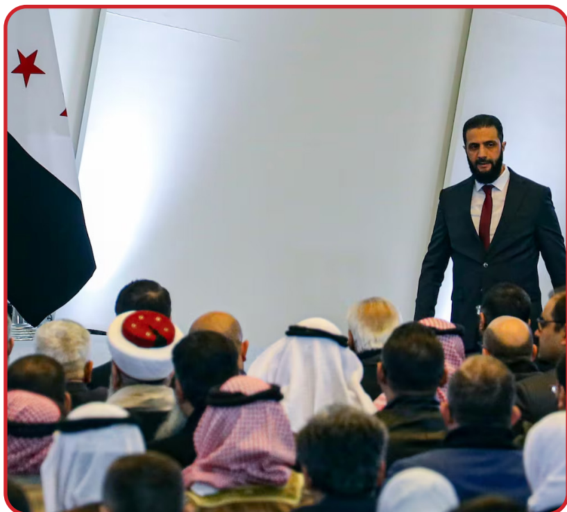
Мгер Симонян, президент Фонда развития евразийского сотрудничества