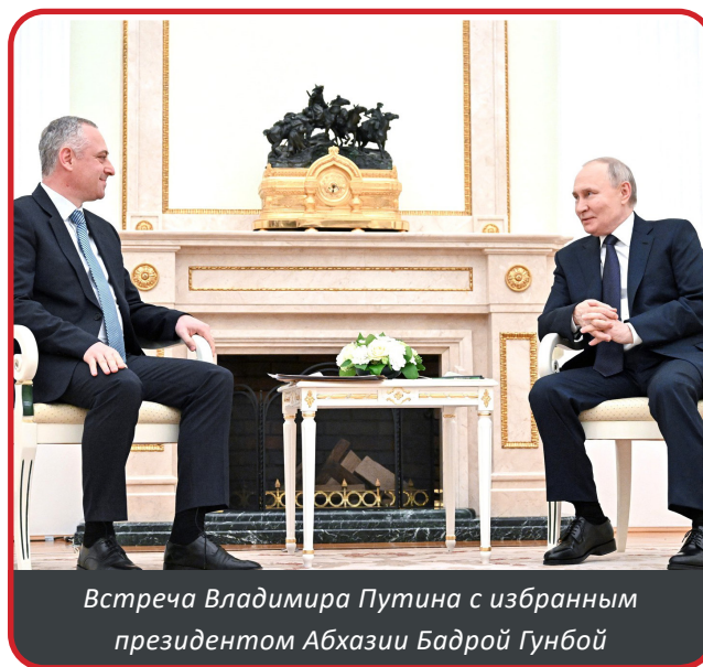
Встреча Владимира Путина с избранным президентом Абхазии Бадрой Гунбой

Как показывает практика предыдущих 20 с лишним лет, стрелковой фактор социально-экономического развития Абхазии – это в первую очередь приток российских капиталовложений в республику. Но известное инвестиционное со-