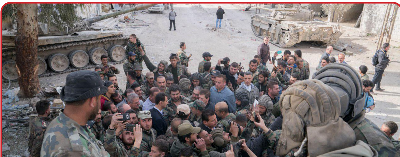
После расформирования проиранские подразделения в Сирии превратились в «спящие» боевые ячейки

Если до инаугурации команда Трампа рассматривала сценарий полного вывода войск из Сирии, то после 20 января она отказалась от этой идеи. Военный контингент на северо-востоке Сирии позволит США сохранить контроль над новыми сирийскими властями, будет противовесом и фактором сдерживания Турции, а также плацдармом для операций против Ирана и его прокси-союзников на Ближнем Востоке. С учетом возобновления Вашингтоном политики максимального давления на ИРИ сирийский плацдарм сохраняет критическую важность в контексте стратегических интересов Вашингтона.