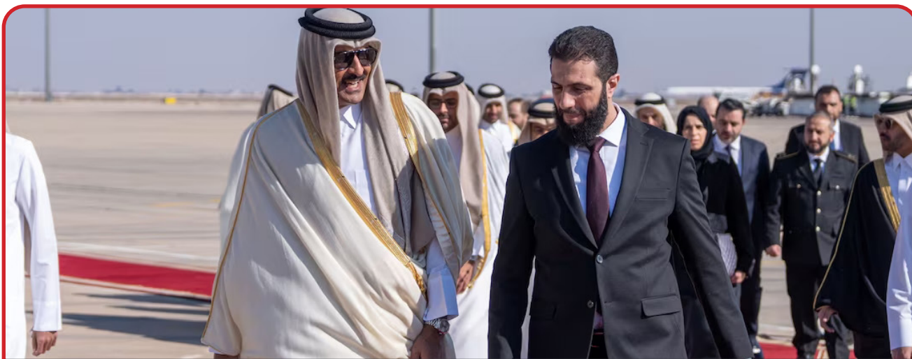
Эмир Катара стал первым арабским лидером, посетившим Сирию после смены власти

– иранский, хотя Иран самоустранился от сирийской проблематики ввиду сложности глобальной ситуации (указом Трампа США возобновили политику максимального давления на ИРИ) но не отказался от региональных интересов. Теперь все его действия будут перенесены в менее осязаемое поле. При необходимости он может влиять на ситуацию в Сирии через сеть союзников среди асадовцев, шиитов или курдов. Сложная этноконфессиональная картина Сирии становится благоприятной почвой для асимме-